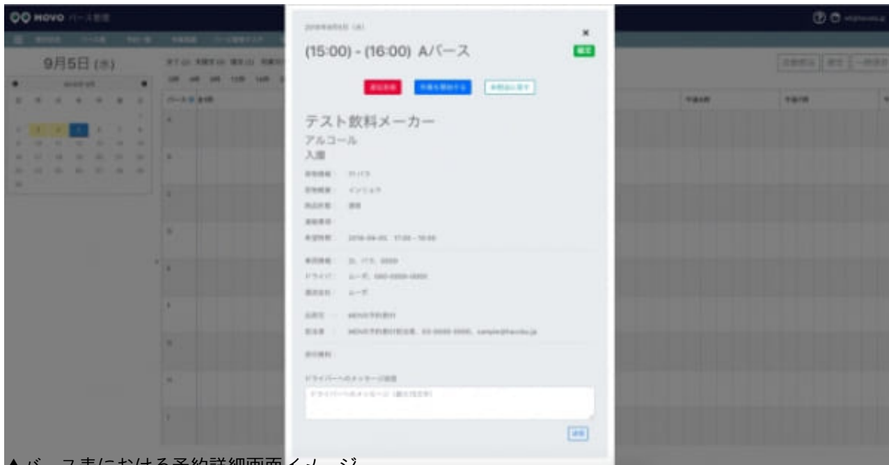
▲バース表における予約詳細画面イメージ

Hacobu（ハコブ、東京都港区）は10日、IoTとクラウドを統合した物流情報プラットフォーム「MOV0」（ムーボ）上で提供しているバース管理ソリューションに、予約に対して「出庫」「入庫」の属性情報を追加できる機能を同日に開発したと発表した。