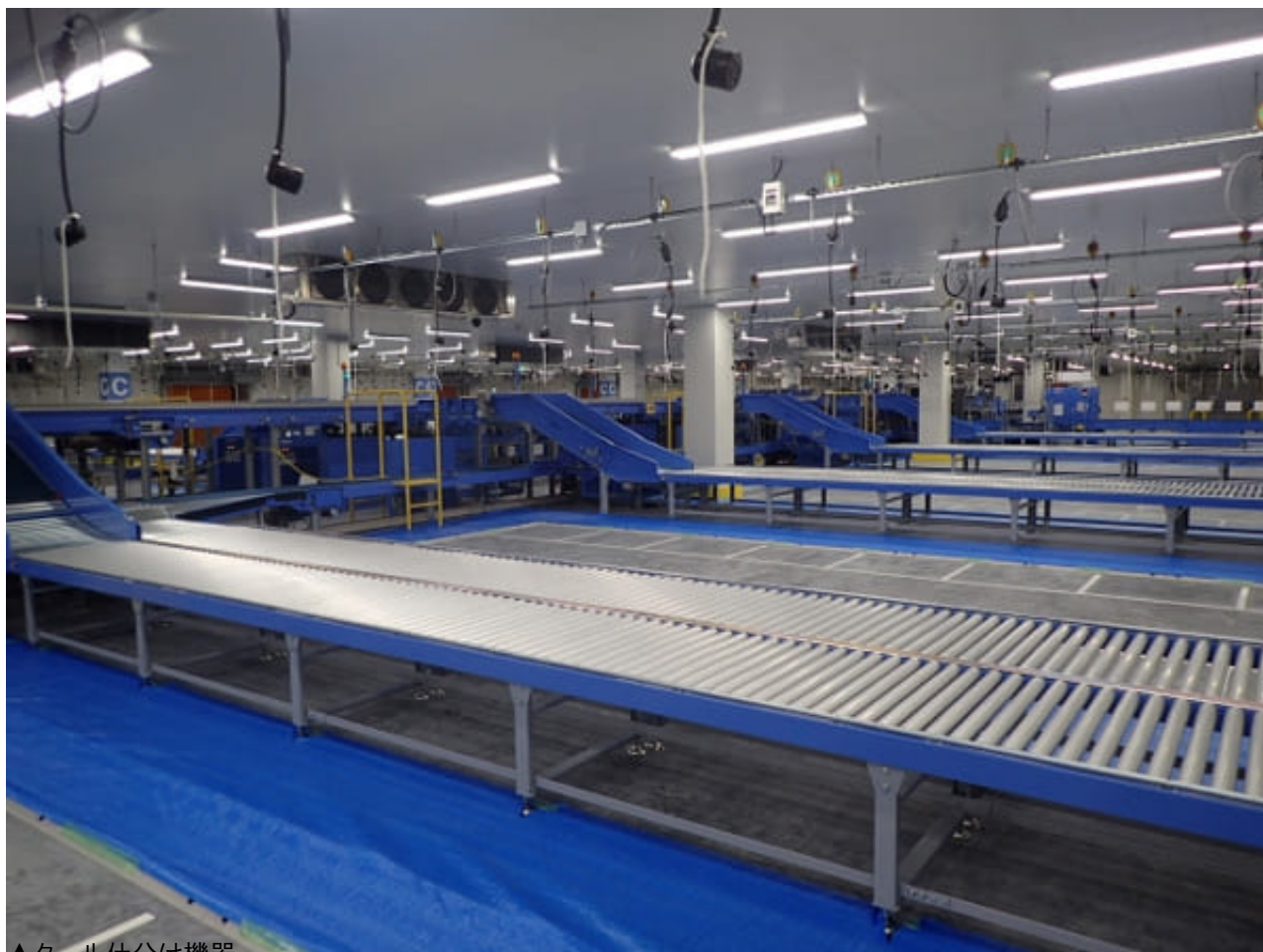
▲ツール仕分け機器

広い敷地内には、給油所と洗車場を設け、乗用車450台分の駐車場も整備しており、駐車場の敷地の一部を利用し、将来的に施設を拡張することが可能。さらに、従業員用通勤バスも運行する。