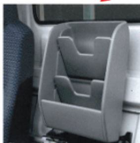
収納スペースを増設 伝票等の書類や小物の収納スペースを増設。運転席から手が届く位置に設置することも重要です。