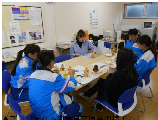
▲プロジェクトの意見交換会の様子

「クローバー」と名付けた同社の専用トラックは、女性ドライバーの活躍の場を広げる目的で発足した「クローバープロジェクト」の一環として開発。着替えや休憩時のストレスを軽減するカーテンや小物入れを備えるなど、女性の快適さを意識した運転室としたほか、機能面でも荷室の荷物固定ベルトを低い位置に設置、外装には車両の名称であるクローバーをデザインし、「環境と人に優しい物流業界に」という願いを込めた。