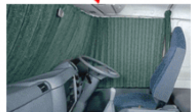
運転席全面をカバーできるカーテン 着替えや休憩時のストレスを軽減します。