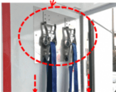
ラッシングベルト※の 収納フックの高さを低い位置に 庫内に装備されています。女性の身長に合わせ、通常車両よりも低い高さに設置。作業のしやすさを考慮しました。