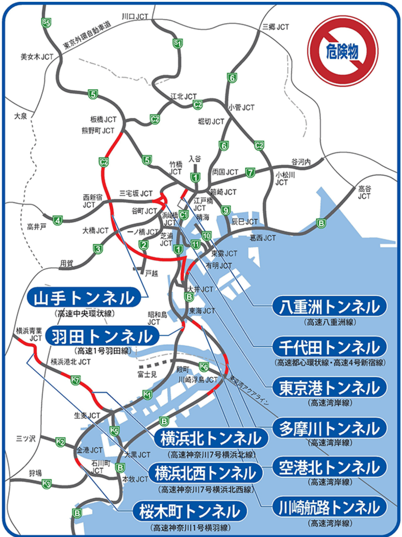
▲首都高速道路の規制対象トンネル