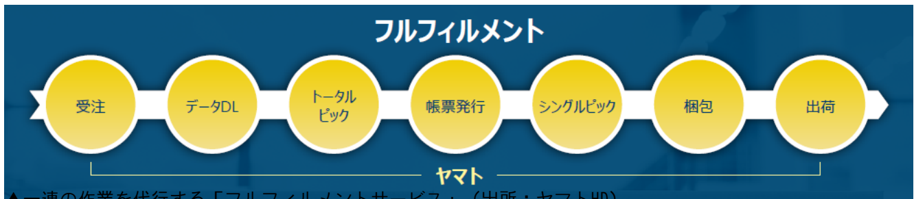
▲一連の作業を代行する「フルフィルメントサービス」

両社は24日、ZHDの「ヤフーショッピング」と「ペイペイモール」出店者を対象に、ヤマトホールディングスが受注から発送・配送までの一連または一部の業務を代行するサービスを発表しており、直後から驚くほど多くの反響を得ているという。