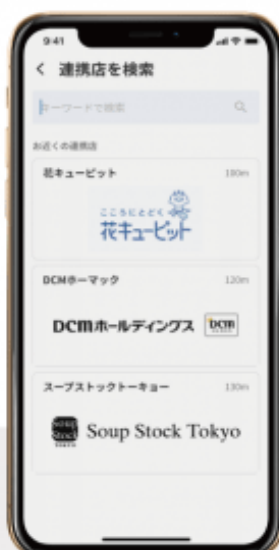
② 連携店舗の一覧から 店舗を指定