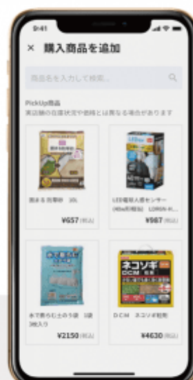
③ 指定した店舗の商 品を追加