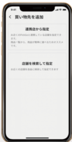
① 買い物先を追加から 連携店を指定を選択